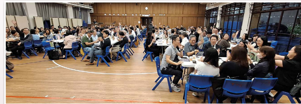
▲ 今年有 191 人出席總議會為歷屆之冠。