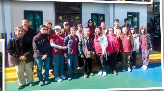
▲ (上) 參加團友在黃宜洲堂前合照 (下) 以往是樂育神學院，現址是西貢崇真堂