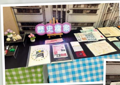
▲ 有關區青的歷史檔案小型展覽 ▶ 展示昔日夏令會的營刊、各堂出版的青年特刊

當日有關區青的歷史檔案小型展覽的亦同樣吸引「曾經是年輕人」的弟兄姊妹們前來觀賞。無論是以往夏令會的營刊、各堂出版的青年特刊、昔日的相片、物件等都勾起他們對區青的回憶，細味著當年的情懷。