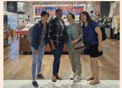
我們四個來自香港、南非、日本和新加坡，因著上帝的愛和恩典可以服侍祂。

感恩12月初能回港數天跟親友相聚，可以陪伴媽媽出席仿如她半個女兒的表妹之婚禮。所有親戚能聚首一堂真是疫情後深感珍貴的時刻。因為回港時間很短促，加上要到醫院求診，所以沒有跟大家分享。現在左眼睛視力已回復正常，但右眼神經振動仍未痊癒，求主醫治。