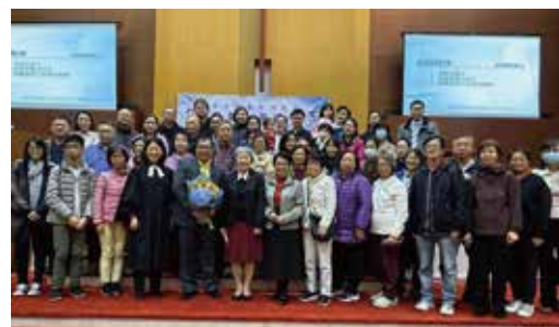
差遣禮與西崇肢體、神學院院長和校友合照