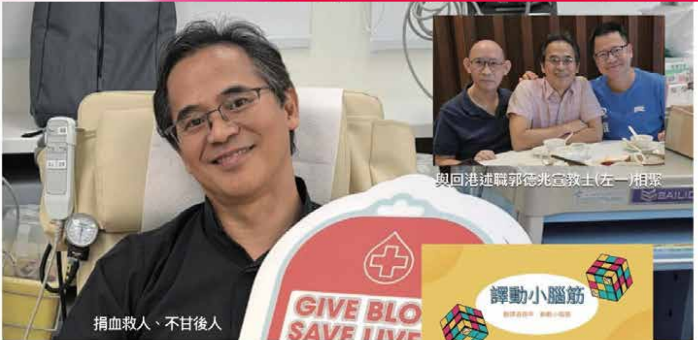
捐血救人、不甘後人