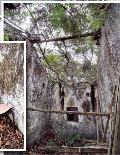
▲ 我在今年五月底去過黃宜洲一次。當時植物還沒有這麼高，我進入了黃宜洲堂內部，拍了幾幅相。沒料到這次再參觀已進不了去。這幾幅相，僅供參考。