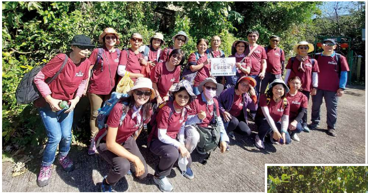
▲ 全體參加者在黃宜洲福音堂前合照