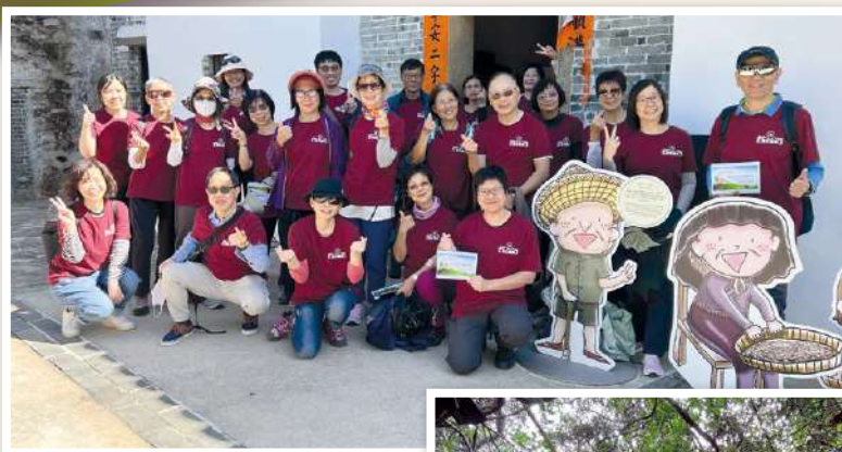
▲ 參觀上窩民俗文物館