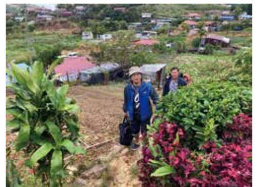
往探訪當地家庭的路上

在整個短宣行程，得到崇真會各堂兄姊妹在背後默默的代禱支持和鼓勵，感到主內一家的團結事奉真是好得無比！行程雖然有辛苦的地方，但亦得到喜樂和滿足，令我們真的非常感恩。