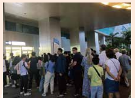
每年往入境處辦簽證也會刷新紀錄！