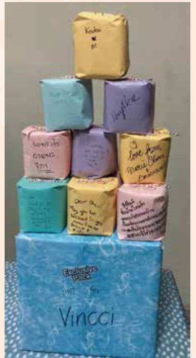
韓國的文化是當新居入伙會送上廁紙作禮物。