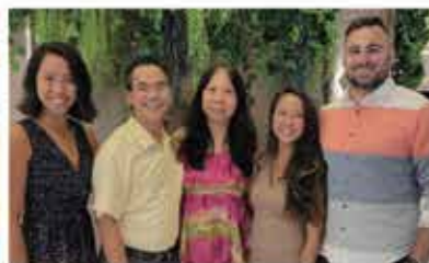
與小女及女婿、全家合照