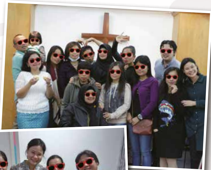
▲ 外傭服務中心會員

想過去十多年在外傭群體（下稱：印尼姐姐）的服侍，除非聖靈特別的催促，筆者相信能夠維繫彼此間的友誼關係比起直接向她們「講耶穌」更為有效！因為大部分在港歸信基督的穆斯林群體，假如沒有足夠的信仰裝備、同行支援和協調當地教會網絡；一旦她們返回家鄉，能持守真道的信心就變得十分脆弱。