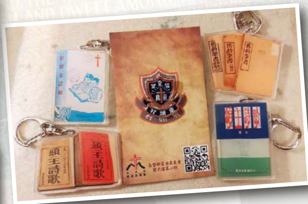
▲ 兩次活動的精美紀念品 ▲ 崇真會三位長老 (左起) 張文彪長老、丘頌云長老及王福義長老蒞臨分享崇真會的教育史。