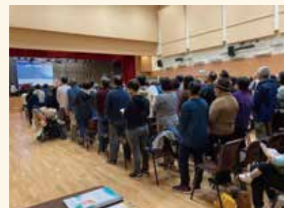
崇真會北區三堂聯合 差傳主日