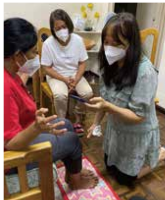
翻譯團隊的退修會中彼此洗腳

在菲律賓的時候，我們遇見很多舊朋友，闊別多年，他們熱誠的款待，使我們心中很溫暖。還有，我們多次吃到當地芬芳馥郁的呂宋芒果，是一件樂事！