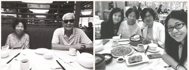
感謝弟兄姊妹前往探望香港的爸媽。